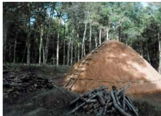
Expérimentation en forêt de Grésigne d'une charbonnière en 2002